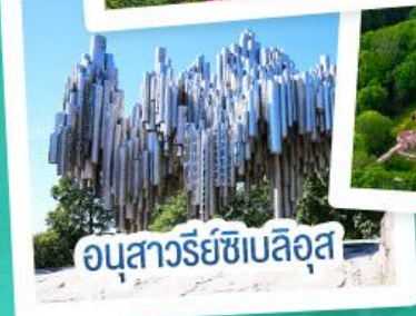
อนุสาวรีย์เซเปิลอูส

ฟินแลนด์ - เอสโตเนีย - ลัตเวีย - ลิทัวเนีย แวะเที่ยวเซี่ยงไฮ้