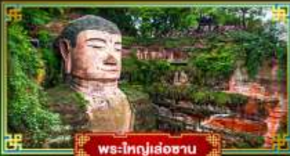
พระใหญ่เล่อซาน