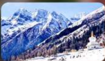
ภูเขาสิ่ดรุณี