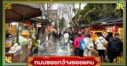
ถนนชอยกวางชอยแคบ