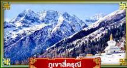
ภูเขาสิ่ดรุณี

ชมวิวฤดูหนาวสุดอลังการอุทยานภูเขาสิ่ดรุณี