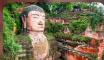
พระใหญ่เล่อซาน