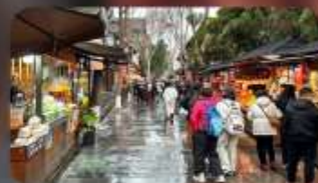
ถนนชอยกวางชอยแคว