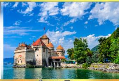
ปราสาทชิลยง