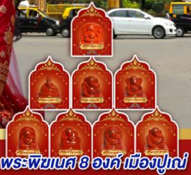
พระพิฆเนศ 8 องค์ เมืองปูणे