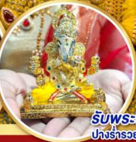
รับพระพิฆเนศปางรำรอย ท่านละ 1 องค์