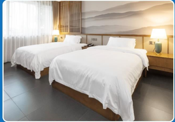
👤👤 TWIN (TWN)