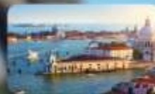
ชมความงามเมืองเวนิส