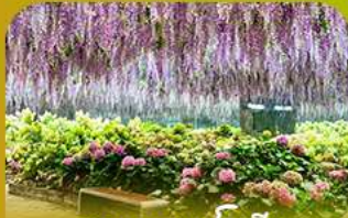
สวนนกเปาเม็ย