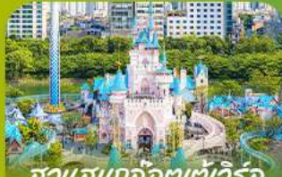
สวนสนุกลิตเติ้ลวีล Lotte Adventure World