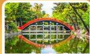
ศาลเจ้าสุมิโยชิ โทเมะ