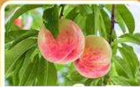
กิจกรรมเก็บผลไม้