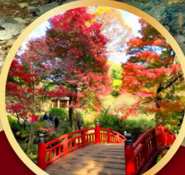
สวนดอกบ๊วยอาคางิ