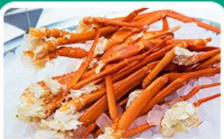
พิเศษ! บุฟเฟ่ต์จางปู