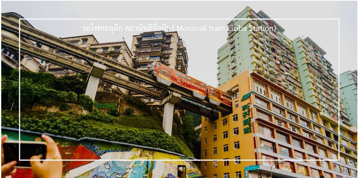
รถไฟฟ้าลู่ติ๊ก สถานีหลี่จื่อเป่า (Monorail train Liziba Station)

ถ่ายภาพโมเมนต์สุดล้ำนี้จากมุมต่างๆ ของเมือง จุดชมวิวนี้ไม่เพียงสร้างความตื่นตาตื่นใจ แต่ยังเป็นสัญลักษณ์ของการผสมผสานระหว่างเมืองสมัยใหม่กับภูมิประเทศที่มีภูเขาและแม่น้ำรายล้อม