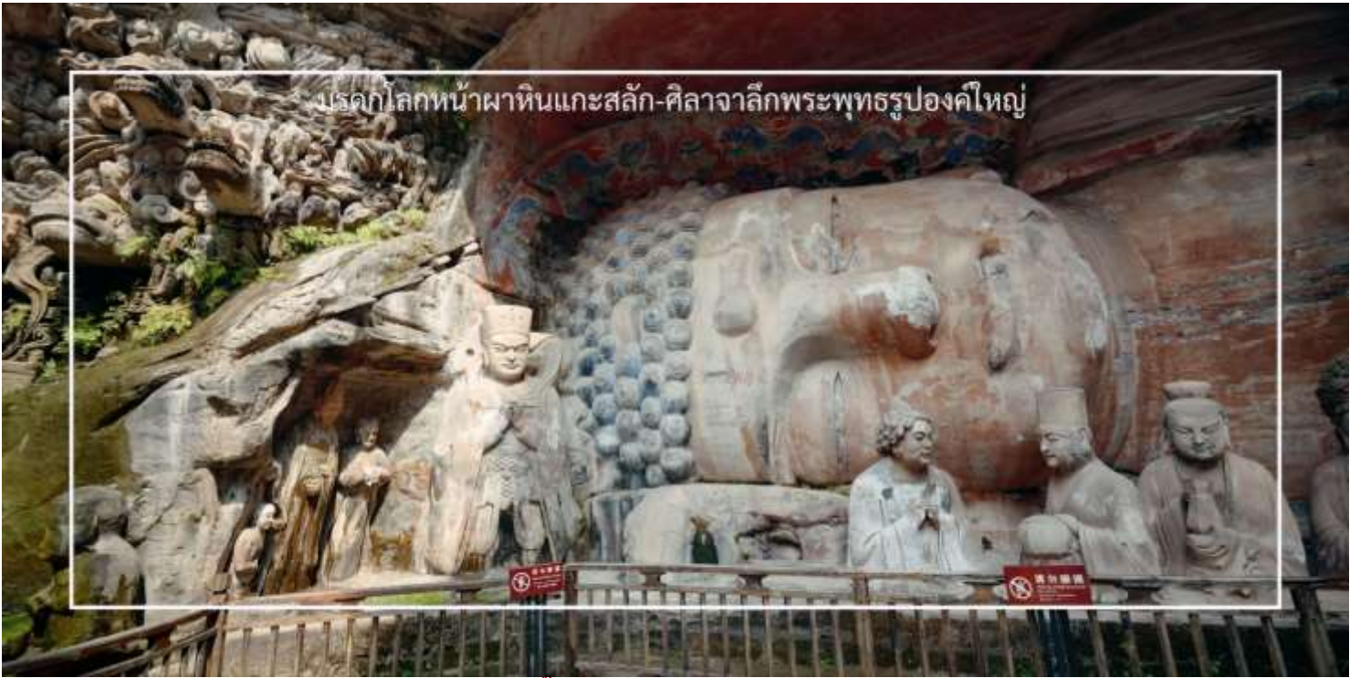
บรรดากล่องหน้าผาหินแกะสลัก-ศิลาจากลึงพระพุทธรูปองค์ใหญ่