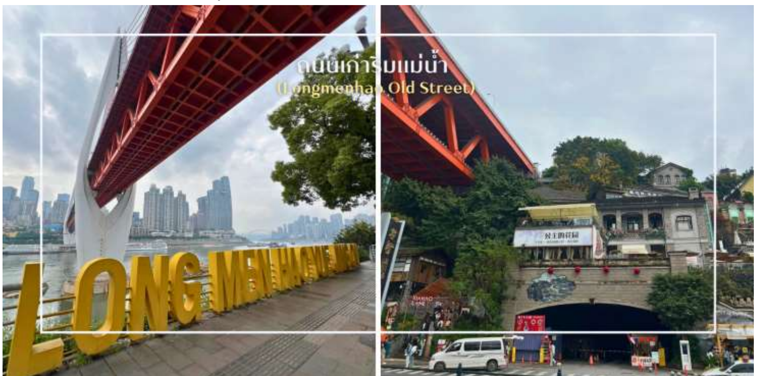
ถนนเก่าริมแม่น้ำ (Longmenhao Old Street)

นำท่านสู่ ถนนโบราณหลงเหมินฮ่าว (Longmenhao Old Street) ถนนเก่าริมแม่น้ำอีกหนึ่งแลนด์มาร์กสำคัญของเมืองฉงชิ่ง ถนนสายนี้เคยเป็นย่านการค้าและศูนย์กลางเศรษฐกิจที่รุ่งเรืองในยุคราชวงศ์หมิงและชิง ปัจจุบันได้รับการอนุรักษ์ไว้อย่างดี เพื่อเป็นแหล่งเรียนรู้ทางประวัติศาสตร์ และแหล่งท่องเที่ยวเชิงวัฒนธรรมที่เต็มไปด้วยเสน่ห์บรรยากาศของถนนยังคงอบอวลไปด้วยกลิ่นอายวันวาน อาคารบ้านเรือนแบบโบราณผสมผสานกับร้านค้า ร้านอาหาร และแกลเลอรีร่วมสมัยอย่างลงตัว อีกทั้งยังเป็นจุดชมวิวแม่น้ำที่โดดเด่น สามารถมองเห็นสะพานข้ามแม่น้ำแยงซีและทัศนียภาพของเมืองฉงชิ่งในมุมที่สวยงาม และอีกหนึ่งจุดหมายที่สะท้อนเสน่ห์ดั้งเดิมของที่นี่คือ Xiahaoli Old Street ตรอกซอกซอยแคบ ๆ บันไดหิน และสถาปัตยกรรมไม้โบราณที่ยังคงกลิ่นอายของวิถีชีวิตในอดีต แม้ในปัจจุบันจะได้รับการบูรณะและพัฒนาให้เหมาะกับการท่องเที่ยว ก็ยังคงรักษาบรรยากาศคลาสสิกเอาไว้ได้อย่างดี