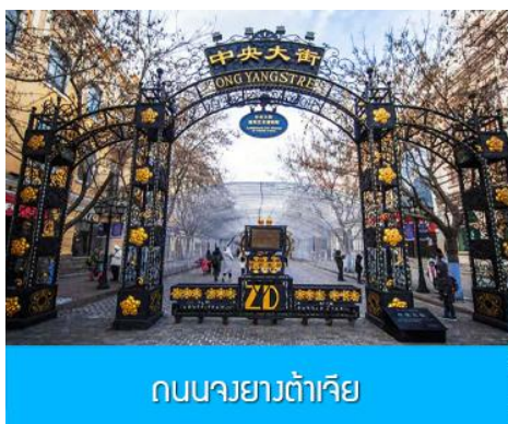
ถนนจงยางต้าเจีย