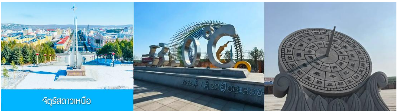
จัตุรัสดาวเหนือ