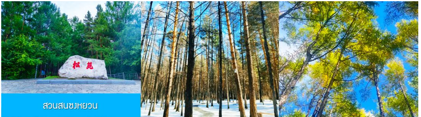
สวนสนขงหยวน

เช้า รับประทานอาหารเช้า ณ ห้องอาหารของโรงแรม (22)