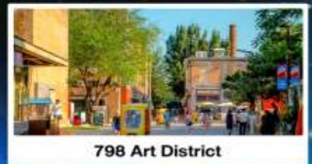
798 Art District