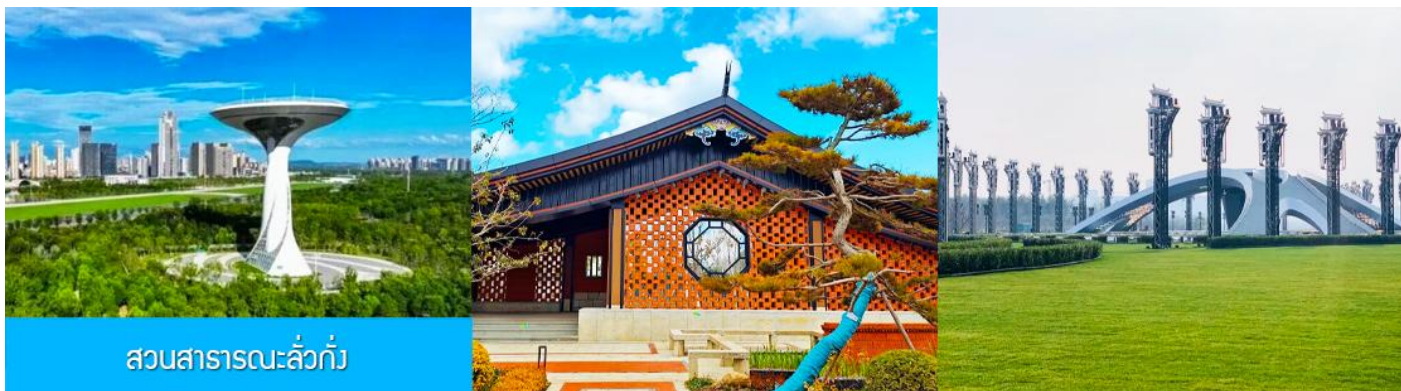
สวนสาธารณะลั่วกั๋ว

เช้า รับประทานอาหารเช้า ณ ห้องอาหารของโรงแรม (8)