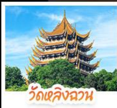
วัดเลิ่งฉวน