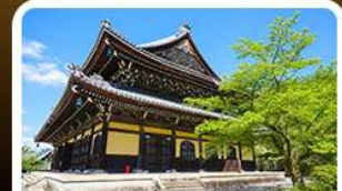
วัดนันเซ็นจิ