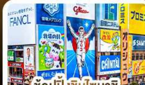
ช้อปปิ้งชินไซบาชิ และโดตงโบริ