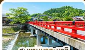
สะพานนากะบาชิ ทาคายาม่า