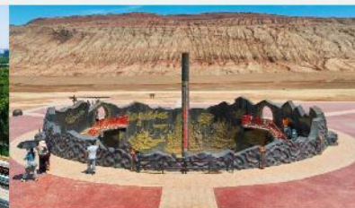
ภูเขาเปลวเพลิง

*ทางบริษัทฯ ขอสงวนสิทธิ์ในการสลับโปรแกรมทัวร์ตามความเหมาะสมขึ้นอยู่กับสถานการณ์หน้างาน โดยคำนึงถึงผลประโยชน์ของลูกค้าเป็นสำคัญ