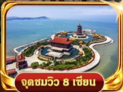
จุดชมวิวกว 8 เซียน