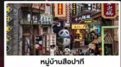
หมู่บ้านสีปาร์ก