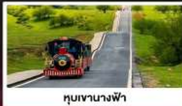
หุบเขานางฟ้า