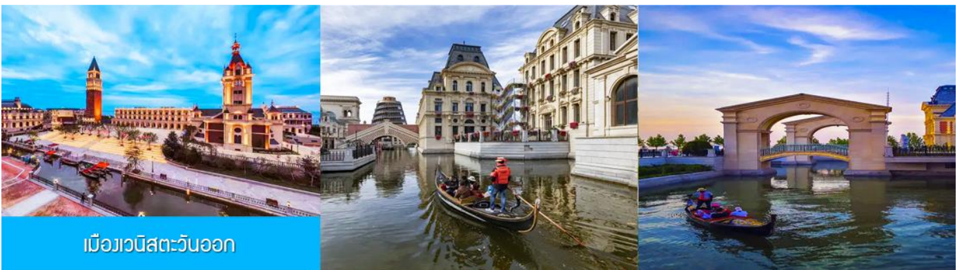
เมืองเวนิสตะวันออก

จากนั้นนำท่านเที่ยวชม เมืองเวนิสตะวันออก 大连东方威尼斯城 เป็นเมืองเวนิสจำลองที่ถูกสร้างขึ้นด้วยทุนกว่า 8,000 ล้านบาท ออกแบบโดยบริษัท ARC จากประเทศฝรั่งเศส โดยจำลองผังเมืองเวนิสในประเทศอิตาลี