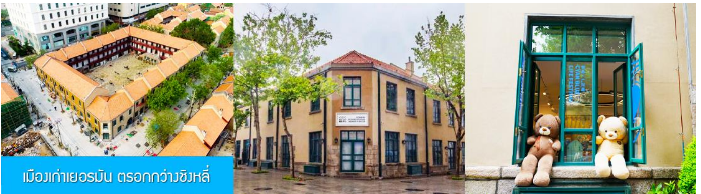
เมืองเก่าเยอรมัน ตรอกกว้างชิงหลี