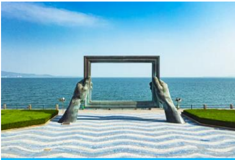
กรอบรูปวิวทะเล