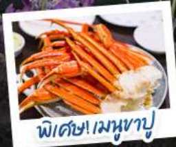
พิเศษ! เมฆหอบู