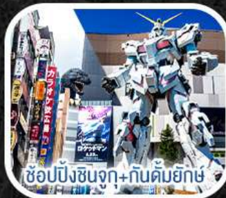
ซอปปิงเซ็นจู+กันดั้มยักษ์