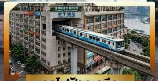
รถไฟฟ้าทะลุติ๊ก