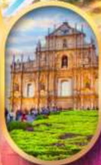
โบสถ์เซนต์พอล