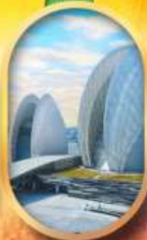
โรงละครไข่มุก