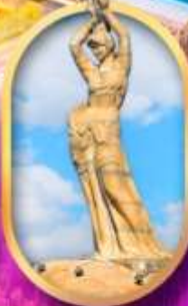
เด็กหญิงชาวประมง