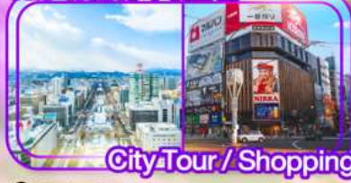
City Tour / Shopping