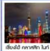
เซี่ยงไฮ้ ทัศนียภาพ ไท่