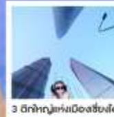
3 มิติทำหุ่นเมืองเซี่ยงไฮ้