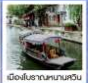
เมืองโบราณหนานศวิน