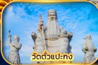
วัดตัวแปะกง