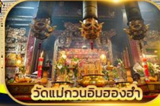
วัดแม่กวนอิมฮ่องอ่า