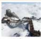
ภูเขาลินมิงกรหยก