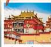
วัดผานงจันหลิง