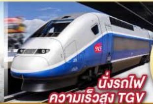
นั่งรถไฟ ความเร็วสูง TGV