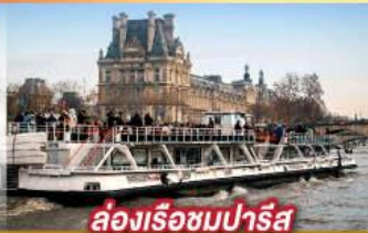
ล่องเรือชมปารีส