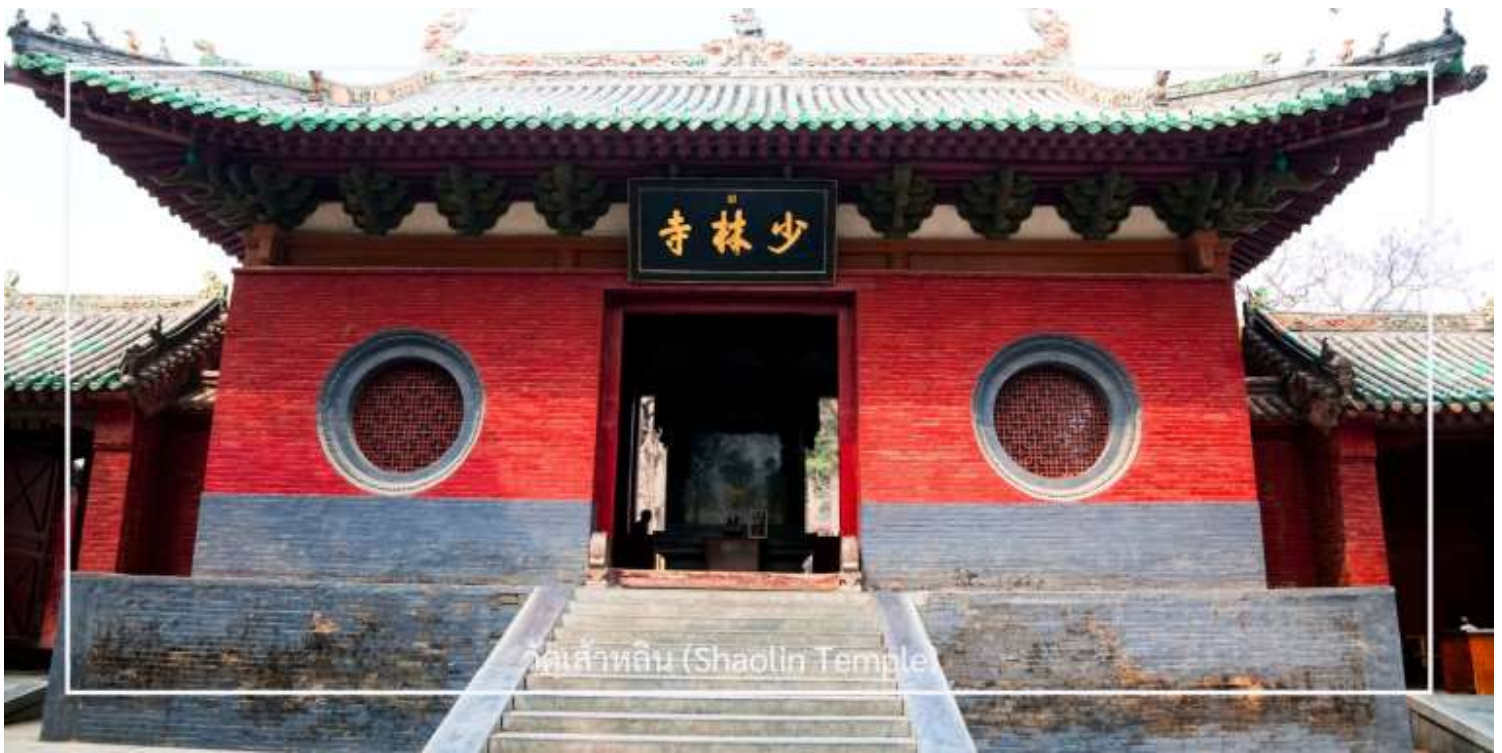
วัดเส้าหลิน (Shaolin Temple)

ไม่พลาด! กับประสบการณ์สุดพิเศษ ชมการแสดงกังฟูวัดเส้าหลิน ศิลปะการป้องกันตัวระดับตำนานที่เลื่องชื่อไปทั่วโลก การแสดงถ่ายทอดความแม่นยำ รวดเร็ว และแข็งแกร่งของวิทยายุทธเส้าหลิน ผ่านกระบวนการที่ได้รับความบันดาลใจจาก สัตว์นานาชนิด เช่น เสือ กู กระเรียน ผสานเข้ากับการตีลังกา หมุนตัว และการควบคุมร่างกายอันน่าทึ่ง ด้วยแสง สี เสียง และดนตรีประกอบฉากที่จัดเต็ม ทำให้โชว์นี้เต็มไปด้วยพลังและความเร้าใจ นอกจากนี้ ผู้ชมยังมีโอกาสได้มีส่วนร่วมบนเวที เพิ่มความสนุกสนาน และประทับใจไม่รู้ลืม