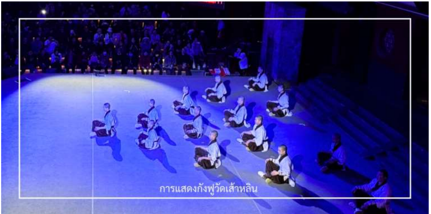
การแสดงกังฟูวัดเส้าหลิน

ไม่พลาด! กับประสบการณ์สุดพิเศษ ชมการแสดงกังฟูวัดเส้าหลิน ศิลปะการป้องกันตัวระดับตำนานที่เลื่องชื่อไปทั่วโลก การแสดงถ่ายทอดความแม่นยำ รวดเร็ว และแข็งแกร่งของวิทยายุทธเส้าหลิน ผ่านกระบวนการที่ได้รับความบันดาลใจจาก สัตว์นานาชนิด เช่น เสือ กู กระเรียน ผสานเข้ากับการตีลังกา หมุนตัว และการควบคุมร่างกายอันน่าทึ่ง ด้วยแสง สี เสียง และดนตรีประกอบฉากที่จัดเต็ม ทำให้โชว์นี้เต็มไปด้วยพลังและความเร้าใจ นอกจากนี้ ผู้ชมยังมีโอกาสได้มีส่วนร่วมบนเวที เพิ่มความสนุกสนาน และประทับใจไม่รู้ลืม