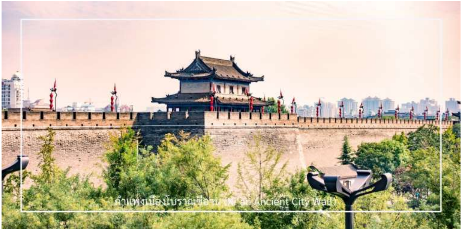
กำแพงเมืองโบราณซีอาน (Xi'an Ancient City Wall)

นำท่านขึ้นชม กำแพงเมืองโบราณซีอาน (Xi'an Ancient City Wall) อีกหนึ่งกำแพงเมืองโบราณเก่าแก่และสมบูรณ์ที่สุดของจีน สร้างขึ้นในสมัยราชวงศ์หมิงเมื่อกว่า 600 ปีก่อน มีความยาวโดยรอบประมาณ 13.7 กิโลเมตร กว้าง 12-14 เมตร และสูงราว 12 เมตร ออกแบบอย่างแข็งแกร่งเพื่อการป้องกันเมือง โดยมีป้อม ประตูเมือง และคูน้ำล้อมรอบ ปัจจุบันกลายเป็นแหล่งท่องเที่ยวยอดนิยม นักท่องเที่ยวสามารถเดินเล่นหรือปั่นจักรยานบนกำแพง เพื่อชมทัศนียภาพของเมืองซีอานทั้งภายในและภายนอกเขตกำแพงได้อย่างชัดเจน