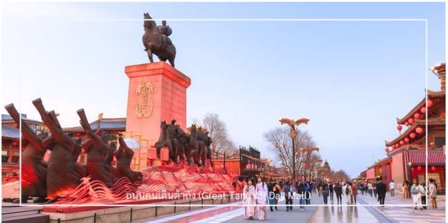
ถนนคนเดินต้าถัง (Great Tang All Day Mat)