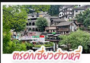
ตรอกเซียวฮ่าวเฉี