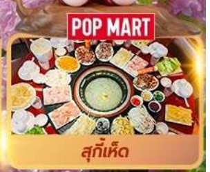
สุกี้หืด