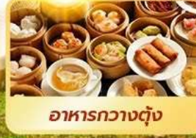
อาหารกวางตุ้ง