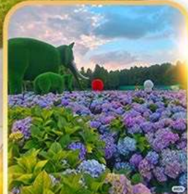
ดอกไม้ตามฤดูกาล