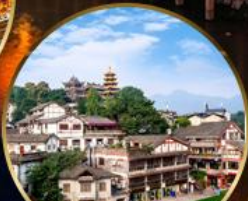
เมืองโบราณฉือจี้โซ่ว