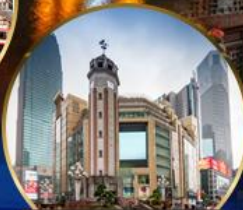
ถนนคนเดินเจียฟางเป่ย์