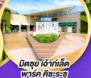
มิตซึยามะ เอ็งากะอิเคดะ พาร์ค คิชะระชู