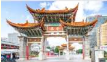
ประตูม้าทองโก่หยก