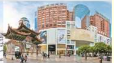
ถนนคนเดินหนานผิงเจีย

*ทางบริษัทฯ ขอสงวนสิทธิ์ในการสลับโปรแกรมทัวร์ตามความเหมาะสมขึ้นอยู่กับสถานการณ์หน้างาน โดยคำนึงถึงผลประโยชน์ของลูกค้าเป็นสำคัญ