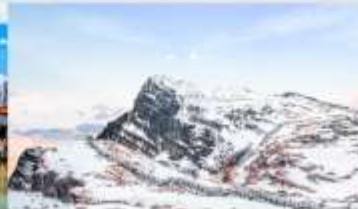
ภูเขาหิมะเจี้ยวจื้อ