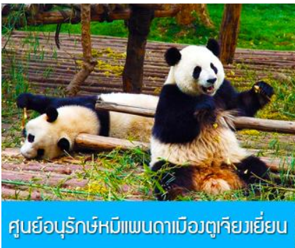
ศูนย์อนุรักษ์หมีแพนด้าเมืองตูเจียงเขียน

หลังอาหารท่านสามารถเลือกที่จะซื้อโปรแกรมทัวร์เสริม หรืออิสระพักผ่อนตามอัธยาศัยในโรงแรม