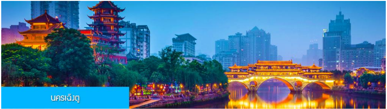
นครเฉิงตู