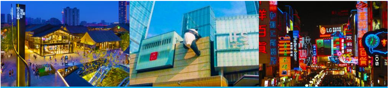
ถนนไท่กุ่หลี่ และวัดต้าอ้อ