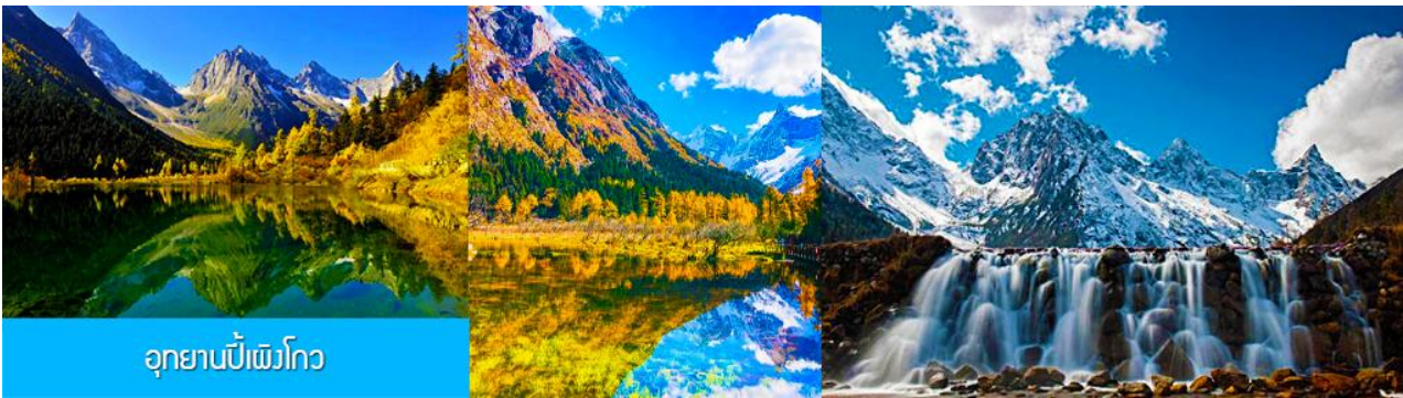
อุทยานปีงโงว

หลังอาหารนำท่านเที่ยวชม อุทยานπίงโงว 毕鹏沟景区 ที่เป็นแหล่งท่องเที่ยวธรรมชาติที่สวยงามได้รับฉายาว่าเป็นสวิตเซอร์แลนด์แดนใต้แห่งเมืองเสฉวน ตั้งอยู่เหนือระดับน้ำทะเลระหว่าง 2,015 เมตร – 3,500 เมตร ครอบคลุมพื้นที่ 614 ตารางกิโลเมตร ได้รับการขึ้นทะเบียนเป็นอุทยานท่องเที่ยวธรรมชาติระดับ 4A ของจีนในปี ค.ศ. 2013 และกลายเป็นอุทยานท่องเที่ยวยอดนิยมที่มีนักท่องเที่ยวเดินทางมาเยือนในปี 2023 ...นำท่านขึ้นรถบัสของอุทยานเพื่อเข้าไปยังเขตอุทยาน นำท่านขึ้นรถกอล์ฟแวะเที่ยวจุดชมวิวสำคัญต่าง ๆ ภายในเขตอุทยาน ที่ประกอบด้วย ธารน้ำแข็งและภูเขาหิมะ โอบล้อมอุทยาน ทะเลสาบที่มีสีน้ำเขียวมรกต ป่าไม้ ลำธารน้ำใสสะอาด น้ำตก ทุ่งหญ้าบนพื้นที่สูง ใบไม้เปลี่ยนสีและป่าไม้หลากสีในฤดูใบไม้ร่วง ทุ่งดอกไม้ในฤดูใบไม้ผลิ โดยมีจุดชมวิวขึ้นชื่อต่าง ๆ อาทิ เขาอูฐ เขากระต่าย เขาสิงค์โต น้ำตกมังกรเขียว ทะเลสาบจิวหม่า และอ่าววงพระจันทร์ ฯลฯ จนควรแก่เวลา นำคณะขึ้นรถบัสออกจากอุทยาน นำท่านเดินทางโดยรถบัสกลับเมืองดูเจียงเซียน