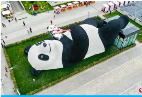
ตุ๊กตาทหมีแพนดาเซลฟี