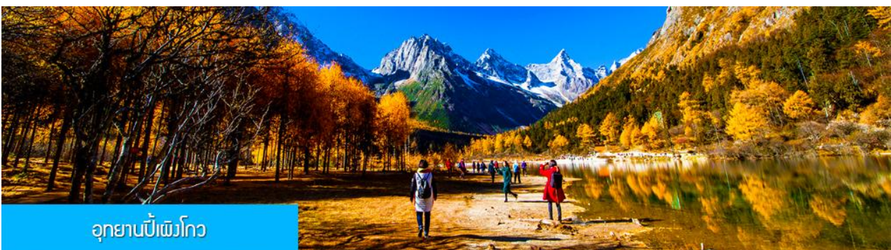
อุทยานปีเพิงโกว

พักที่ โรงแรม LAVANDA HOTEL ระดับ 4 ดาวท้องถิ่นหรือเทียบเท่าในเมืองตูเจียงเยียน