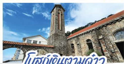
โบสถ์หินตามด้าว