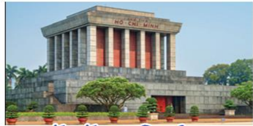
จัตุรัสบาติงห์