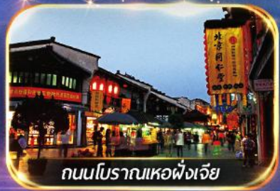
ถนนโบราณเหอผิงเจีย

เช็คอินมุมนิตใน TIKTOK ณ หาดไว่ทาน เตอะบันด์ + หอไข่มุก อิสระช้อปปิ้งย่านดัง หรือ เลือกซื้อ OPTION SHANGHAI DISNEYLAND