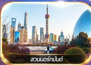
สวนนอร์กบันด์