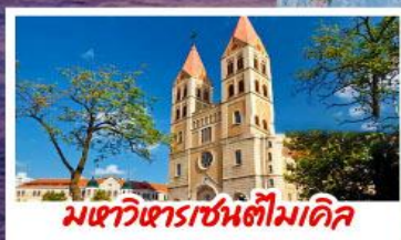
มหาวิหารเซนต์ไมเคิล