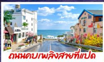
ถนนคาสปิออสที่แปด