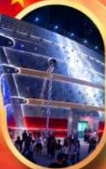
เรือเดอะหลุยส์