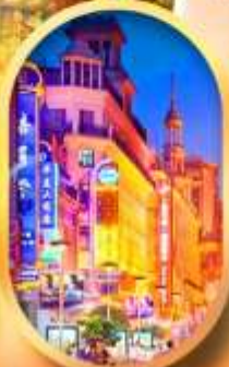
ถนนหนานกิง