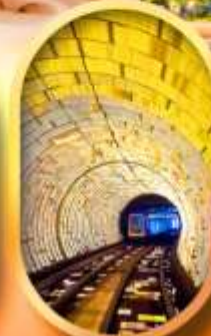
อุโมงglesเซอร์