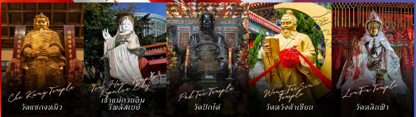
Che Kung Temple วัดแซกงหมิว

รายการทัวร์ข้างต้นอาจมีการปรับเปลี่ยนเพื่อความเหมาะสม