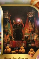
วัดผานไหว