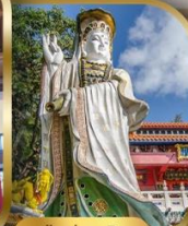
เจ้าแม่กวนอิม ริพลัสเบย์