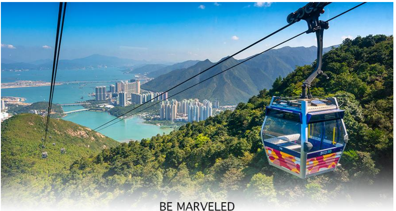
BE MARVELED กระเช้านองปิง

ล่าง ซึ่งการเดินทางขึ้นไปสักการะองค์พระใหญ่อย่างใกล้ชิดนั้น ต้องเดินขึ้นบันได จำนวน 268 ขั้นและได้รับเลือกให้เป็นสิ่งมหัศจรรย์ทางวิศวกรรมขั้นที่ 4 จากทั้งหมด 10 ชั้นของฮ่องกงในปี ค.ศ. 2000 ถือเป็นพระพุทธรูปองค์ใหญ่ที่เป็นสุดยอดของประติมากรรมทางพุทธศาสนาที่มีการผสมผสานระหว่างศิลปะสำริดแบบดั้งเดิมกับเทคโนโลยีสมัยใหม่ ชาวฮ่องกงเชื่อว่า หากใครได้มานมัสการขอพรองค์พระใหญ่แห่งนี้แล้ว ชีวิตก็จะมีแต่ความโชคดี มีความสุขสมหวัง และประสบความสำเร็จในทุกๆ ด้าน หลังจากไหว้พระแล้วท่านสามารถเลือกซื้อของฝาก, ของที่ระลึก จากหมู่บ้านนองปิง อาทิเช่น หยก ไข่มุก หรือเครื่องประดับคริสตัล เพื่อเป็นของที่ระลึก จากนั้นนั่งกระเช้ากลับลงมายังสถานีตุ่งซุง