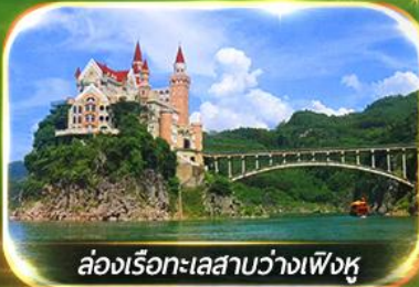
ล่องเรือทะเลสาบว่างเฟิงหู