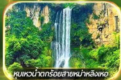
หุบเขาน้ำตกร้อยสายหม่าหลิงเหอ

ชมป่าภูเขาหมื่นยอด, เที่ยวหมู่บ้านโบราณหลินปู้อี ล่องเรือทะเลสาบว่างเฟิงหู, ชมสวนดอกไม้ตามฤดูกาล