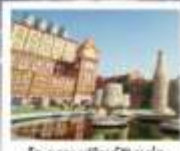
โรงแรมเบียร์ชิงเต่า