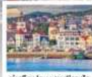
ท่าเรือประมงเหมียนโก๋