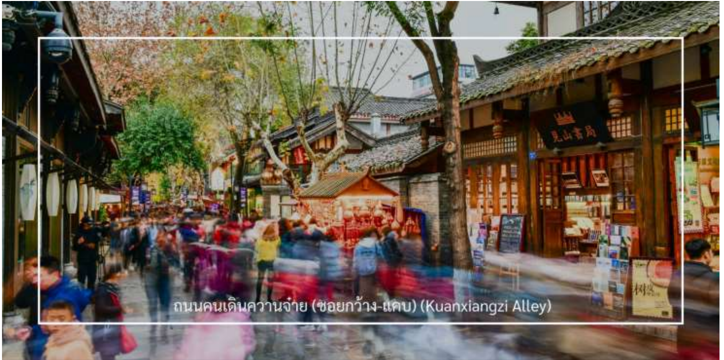
ถนนคนเดินความจ๋าย (ชอยกว้าง-แคบ) (Kuanxiangzi Alley)

เที่ยวชม ถนนคนเดินความจ๋าย (ชอยกว้าง-แคบ) (Kuanxiangzi Alley) ถนนโบราณหรือในชื่อภาษาไทยจะถูกแปลออกมาว่า "ถนนชอยกว้างชอยแคบ" โดยมีนัยว่า หากถนนมีความกว้างนั้นหมายถึงพื้นที่สำหรับคนชนชั้นสูง หรือคนมีฐานะ เพราะคนสมัยนั้นโดยสารกันด้วยรถม้านั่นเอง แต่หากเป็นชอยแคบๆ ก็จะเป็นที่พักอาศัยของคนที่มีฐานะปานกลาง ก่อนจะมีการบูรณะให้กลายเป็นแหล่งท่องเที่ยว ถนนคนเดินความจ๋ายเป็นสถานที่ที่มีความคึกคักและมีชีวิตชีวา โดยเฉพาะในช่วงเย็น ที่ผู้คนมักออกมาเดินเล่นและสนุกกับกิจกรรมต่างๆ ถนนนี้เต็มไปด้วยร้านค้า ร้านอาหาร และร้านขายของที่ระลึก นักท่องเที่ยวสามารถเลือกซื้อสินค้าท้องถิ่น เช่น งานหัตถกรรม เสื้อผ้า และของฝากต่างๆ รวมถึงอาหารท้องถิ่นที่อร่อย