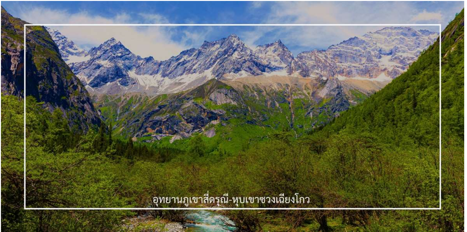
อุทยานภูเขาซีตงรุณี-หุบเขาซวงเฉียวโกว

นำท่านชมเส้นทางไฮไลต์ หุบเขาซวงเฉียวโกว (Shuangqiaogou Valley) (รวมรถอุทยาน) เป็นหนึ่งในสถานที่ท่องเที่ยวที่สวยงามที่สุดของอุทยานภูเขาซีตงรุณี เดินทางง่ายและสะดวกที่สุด เราจะเดินทางเข้าไปยังจุดที่ลึกที่สุด และค่อย ๆ นั่งรถเที่ยวออกมาตามจุดต่าง ๆ เส้นทางนี้รวมจุดสำคัญหลายอย่างไว้ด้วยกัน ทั้งภูเขาที่สูงตระหง่านและปกคลุมไปด้วยหิมะในฤดูหนาว พุ่มหญ้าเขียวขจีในฤดูใบไม้ผลิและฤดูร้อน หรือเห็นธารน้ำแข็งและทะเลสาบต่างๆ ทำให้คุณได้สัมผัสกับความงดงามของธรรมชาติในทุกฤดูกาลได้แบบ 360 องศา