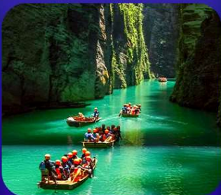
“ ผิงซานแกรนด์แคนยอน ”