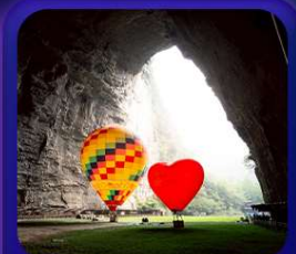
“ ถ้าถึงหลง ”

T2G-CKG29FD ลงชิง เอ็นจีโอ...ถ้าถึงหลง ล่องเรือมังกรกังส่วย ผิงซานแกรนด์แคนยอน 5D 4N (FD)