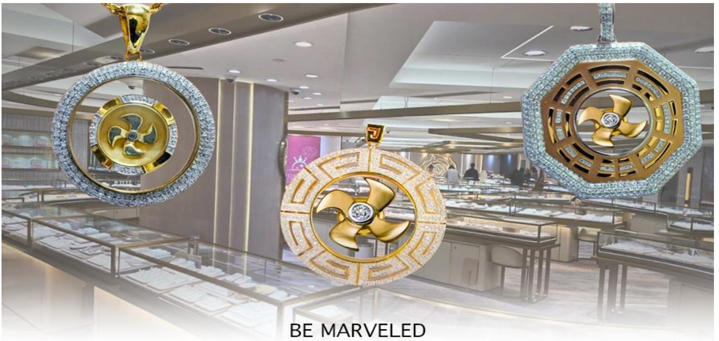
BE MARVELED ศูนย์ฮวงจุ้ย กังหันเศรษฐี

นำท่านชม ศูนย์ฮวงจุ้ย กังหันเศรษฐี ที่ขึ้นชื่อของฮ่องกง ท่านจะได้พบกับงานดีไซน์ที่ได้รับรางวัลยอดเยี่ยม และใช้ในการเสริมดวงเรื่องฮวงจุ้ย โดยการย่อใบพัดของกังหันที่เป็นสัญลักษณ์ของวัดวัดเซ่งหิม มาทำเป็นเครื่องประดับ ไม่ว่าจะเป็นจี้, แหวน, กำไล หรือต่างหูเพื่อเป็นเครื่องประดับติดตัว และเสริมดวงชะตา ซึ่งสินค้าทุกชิ้น มีเอกสาร รับประกันคุณภาพเปลี่ยนหรือซ่อม ได้ตลอดอายุการใช้งาน หากเกิดการชำรุดจากสินค้าไม่ใช่อุบัติเหตุ