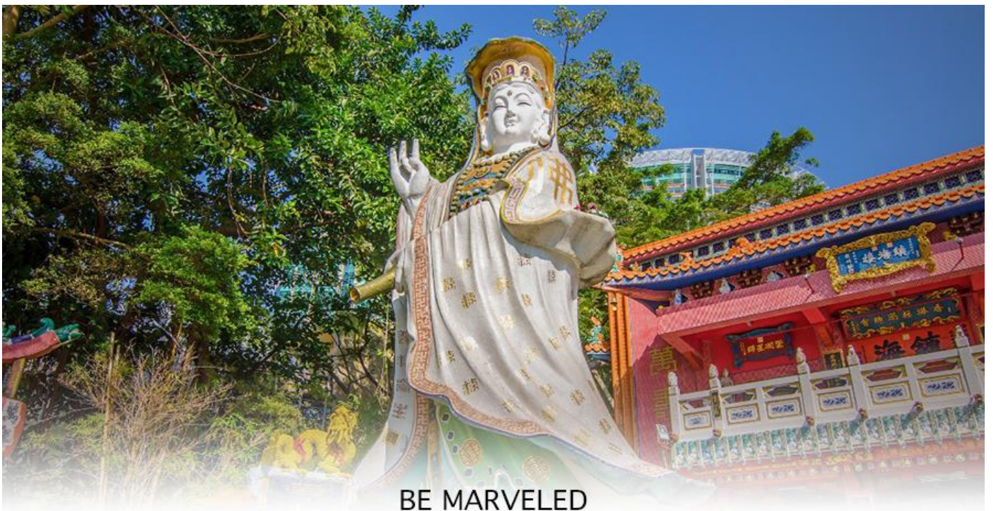
BE MARVELED วัดเจ้าแม่กวนอิมรีพลัสเบย์

จากนั้นนำท่านเดินทางสู่ ชายหาดรีพลัสเบย์ (REPULSE BAY) หาดทรายรูปจันทร์เสี้ยวแห่งนี้เป็นหาดที่สวยงามที่สุดแห่งหนึ่งในฮ่องกง และยังใช้เป็นฉากในการถ่ายทำภาพยนตร์หลายเรื่อง ถือเป็นแหล่งท่องเที่ยวยอดนิยมในหมู่ชาวฮ่องกง นักท่องเที่ยวนิยมมาสักการะที่ วัดทินฮั่ว อารีพลัสเบย์ (TIN HAU TEMPLE REPULSE BAY) ซึ่งตั้งอยู่ริมทะเล เป็นสถานที่ท่องเที่ยวสำคัญ สร้างขึ้นในปี ค.ศ.1993 มีรูปปั้นของ เจ้าแม่กวนอิม ปางประทานพรตั้งอยู่ ซึ่งคนฮ่องกงและคนจีนให้ความเคารพนับถือมากที่สุด เชื่อว่าเป็นเทพที่มีความศักดิ์มากขอพรเรื่องงานการเงิน และขอพรขอโชคลาภเพื่อเป็นสิริมงคลและขอพร