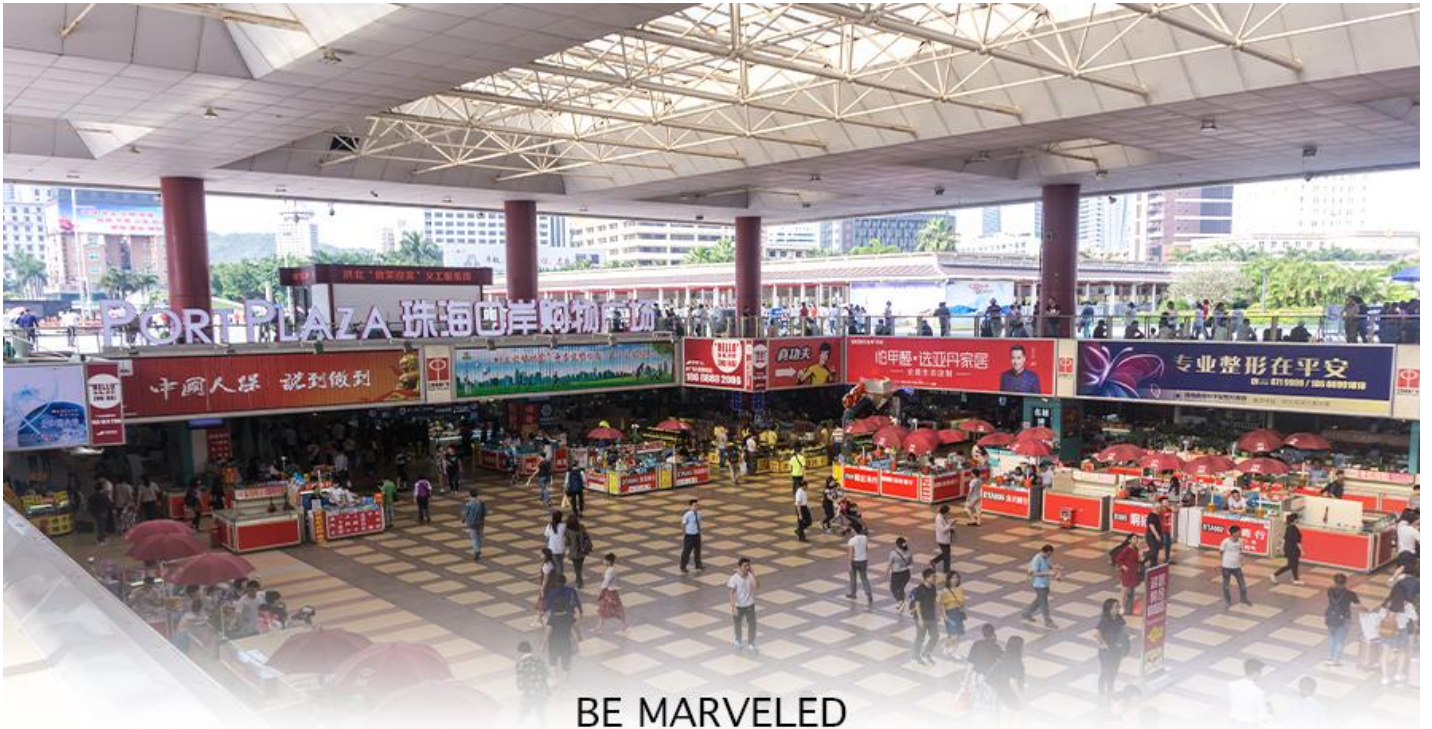
BE MARVELED ตลาดใต้ดิน กวเป่ย์

📍 อิสระอาหารอาหารเย็นตามอัธยาศัย **เพื่อความสะดวกในการซื้อปิ้ง**