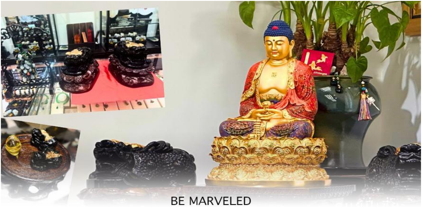
BE MARVELED ศูนย์ปี่เซี่ยะ

และนำท่าน ชม ศูนย์ปี่เซี่ยะ ซึ่งคนจีนนั้น ถือว่าหยกเป็นหิน ที่เป็นตัวแทนของความสวยงามและความบริสุทธิ์มีความเชื่อว่า หยก มงคล ถ้าพกติดตัวไว้จะอายุยืนและสุขภาพดีมีสินค้าน่ามากมายเกี่ยวกับหยก อาทิ กำไลหยก หรือสัตว์นำโชคอย่างปี่เซี่ยะ ให้ ท่านได้เลือกซื้อเป็นของฝาก, ของที่ระลึก หรือของนำโชคแต่ตัวท่านเอง