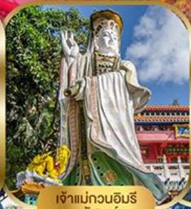
เจ้าแม่กวนอิมรีพลัสเบย์