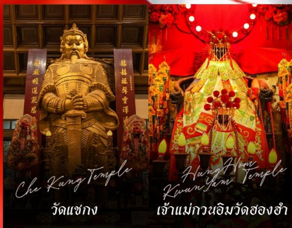
Che Kung Temple วัดแซกง

รายการทัวร์ข้างต้นอาจมีการปรับเปลี่ยนเพื่อความเหมาะสม