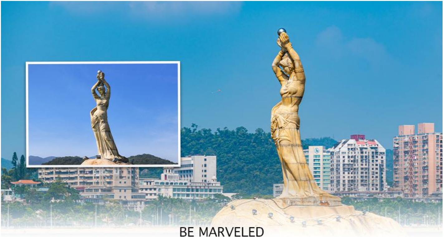
BE MARVELED จุฬารัชมังคลาจารย์