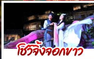
ชีวิตจิ้งจอกขาว