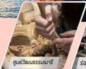
ศูนย์วัฒนธรรมเมารี