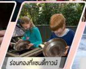
ร้อนท้องที่แซดตีทาวนิ