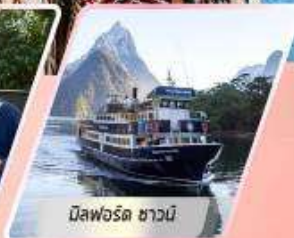
มิสฟอร์ด ซาวนิ