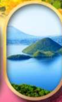
วิวทะเลสาบโทยะ