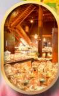
พพิธกันทักล่องดนตรี